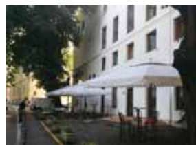
STUDENSKI RESTORANI STUDENSKA REFERADA