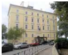
REKTORAT STARI KAMPUS SVEUČILIŠNA KNJIŽARA