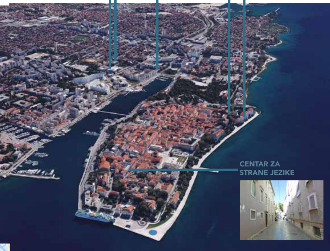
CENTAR ZA STRANE JEZIKE