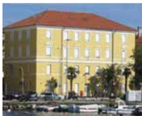
ZNANSTVENI CENTAR CENTAR ZA TJELOVJEŽBU